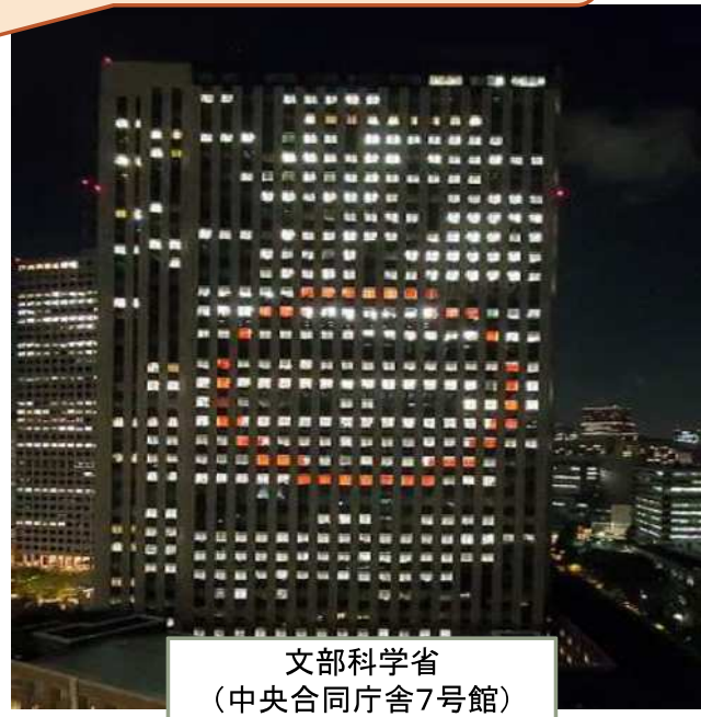
文部科学省 (中央合同庁舎7号館)