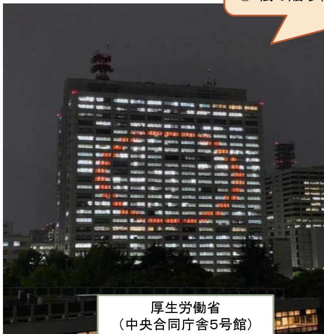
厚生労働省 (中央合同庁舎5号館)