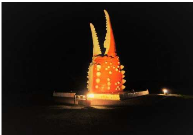
カニの爪 (北海道紋別市)