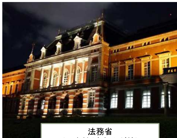
法務省 (旧日本館(赤れんが棟)) ※ライトアップを実施