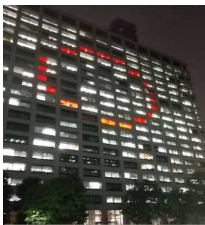
総務省、警察庁、国土交通省 (中央合同庁舎2号館)