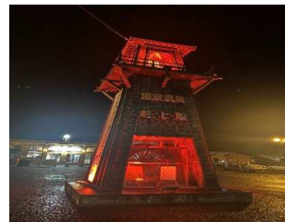
村上駅 (新潟県村上市)