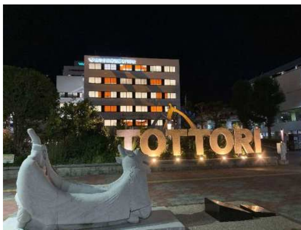
鳥取市医療看護学校 (鳥取県鳥取市)