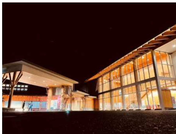
朝日村 (長野県朝日村)