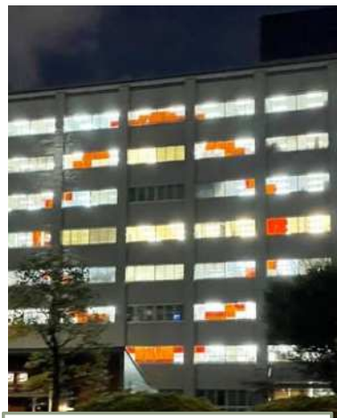
農林水産省 (南別館)