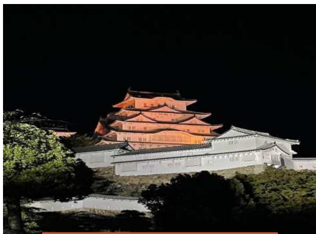
姫路城 (兵庫県姫路市)