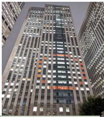
金融庁 (中央合同庁舎7号館)